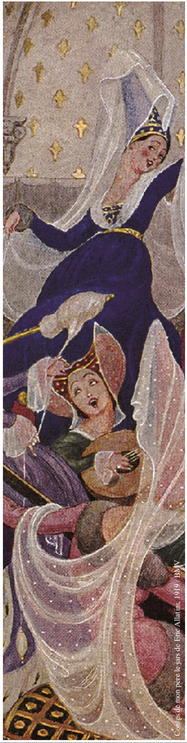
Contes de mon père le jans de Éric Allatrin, 1919/BMV